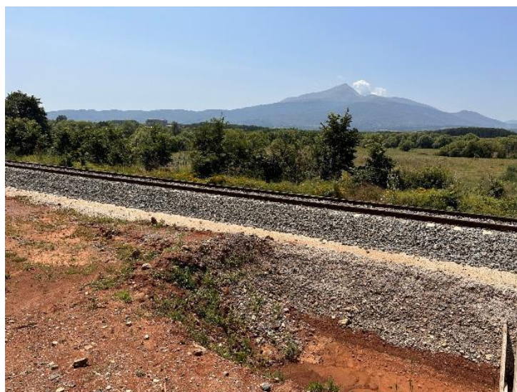
Slika 1-2: Fotografija planirane lokacije WWTP